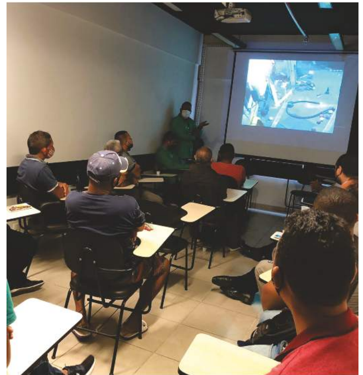
■ Treinamento no Auditório da Lotus.